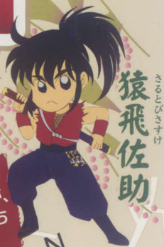
猿飛佐助 さるとびさすけ