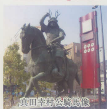
真田幸村公騎馬像